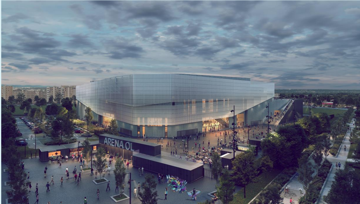
Illustration montrant le rendu architectural du projet dans son environnement (Illustration extraite du dossier d'enquête)

Enquête publique unique portant sur les demandes d'autorisation d'ouverture de travaux et d'exploiter au titre du code minier en vue de l'exploitation d'un gîte géothermique basse température, pour couvrir les besoins de chauffage et de rafraîchissement du projet de salle de rencontres sportives et de spectacles OL Vallée Aréna à Décines-Charpieu ainsi que sur la construction projetée de la salle OL Vallée Aréna